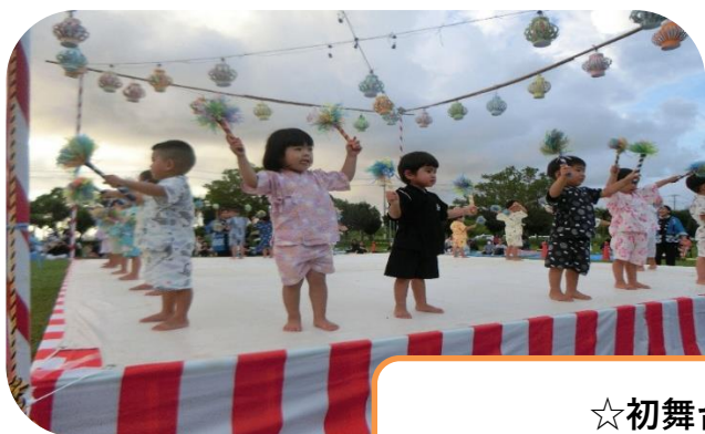
☆初舞台☆ ハイサイ☆さくらぐみやいびん！