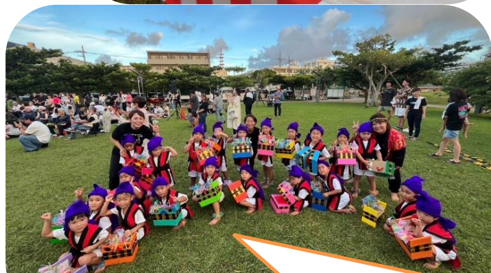
シーシーカンカン Jr 自分で作った獅子舞で憧れのシーシーカンカンデビュー