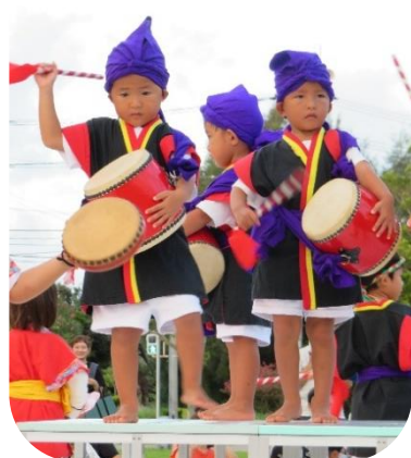
ちびっこ！エイサー隊 手踊り可愛かった♡ 大太鼓かっこいい☆ エイサー隊最高!!