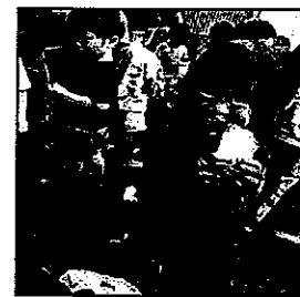
金沢にある みどりの杜こども園さんから 雪が届きました～♪