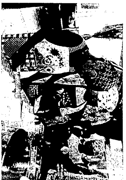
おいしいカレーができますように...♪