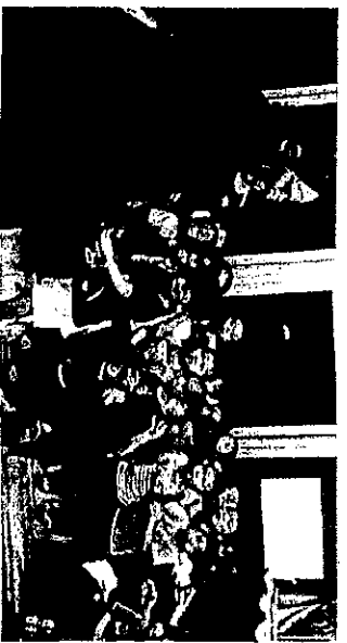
勇気を出してお化け屋敷へ！！