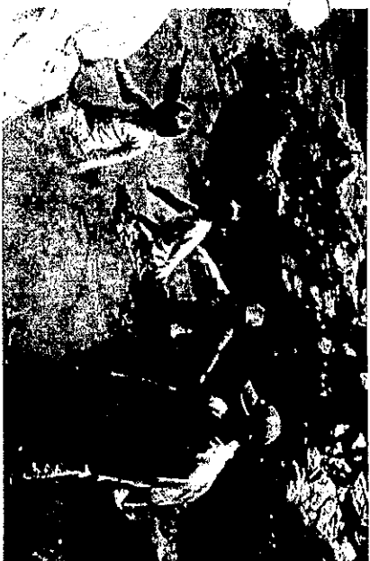
楽しみにしていたターナー！