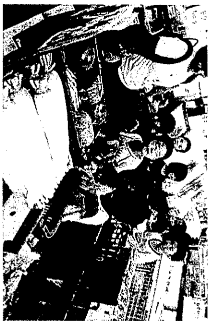
カレー作りのお買いもの♪♪