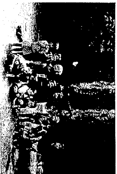
川の水は冷たくて気持ちいい！！