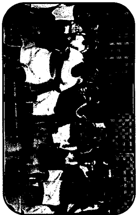
★かかとか上がってきたよ!! (ひまわり組)